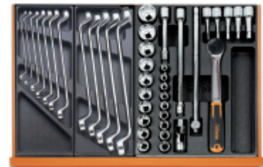
T40 T41 T80