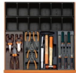
VP6 T137 T145 T234 T236