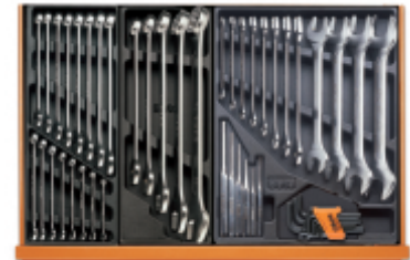
T05 T06 T31