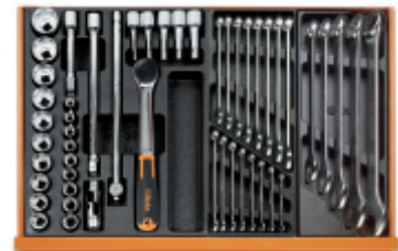
T80 T05 T06