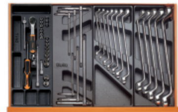
T91MH T68 T40 T41