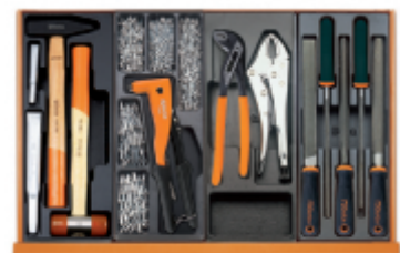
T234 T271 T153 T236