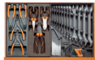
T145 T137 T31