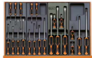
T199MH T202MH T201MH T204MH