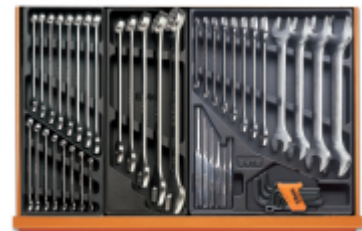
T05 T06 T31