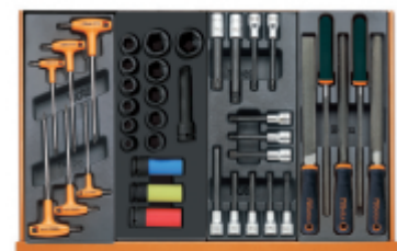
T55 T111 T113 T236