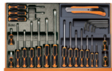
T167MH T168MH +96N +1771