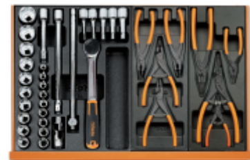
T80 T145 T146