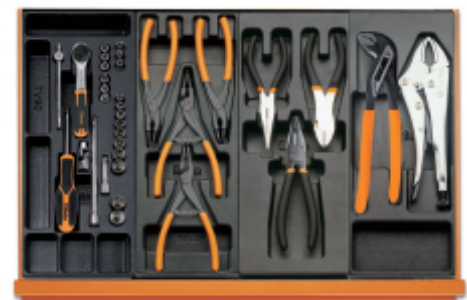
T91MH T145 T138 T153