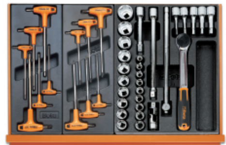
T52 T55 T80