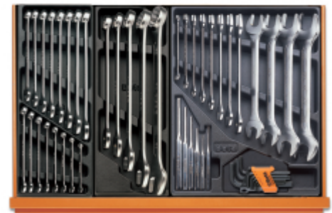
T05 T06 T31