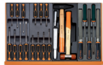
T208MH T205MH T234 T236