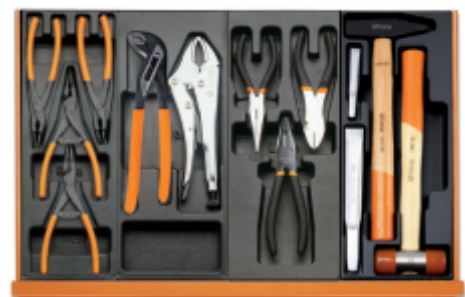
T145 T153 T138 T234