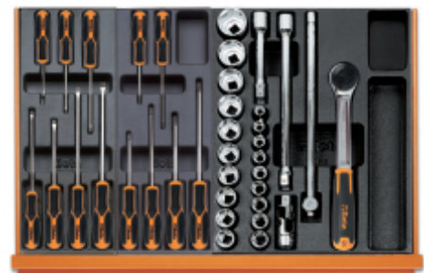
T199MH T202MH T83