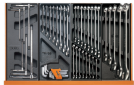
T68 T33 T05 T06