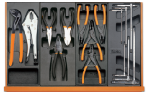
T153 T138 T145 T68