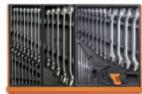
T05 T06 T31