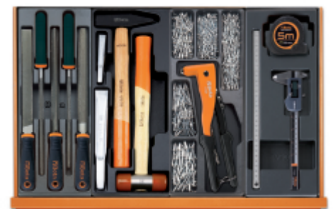
T236 T234 T271 T297