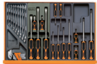
T33 T201MH T202MH T204MH