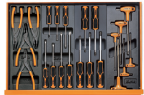
T145 T199MH T206MH T52