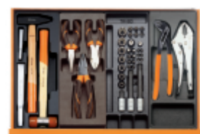
T234 T137 T112 T153