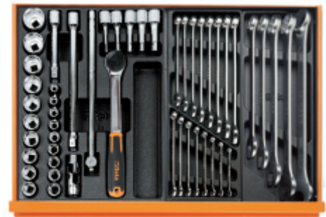
T80 T05 T06