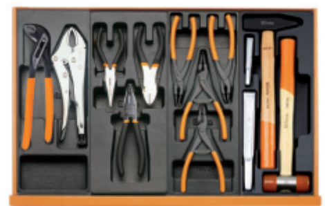
T153 T138 T145 T234