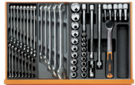
T05 T06 T80