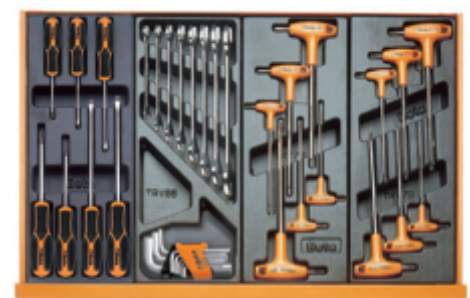
T208MH T33 T52 T55