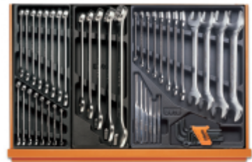
T05 T06 T31