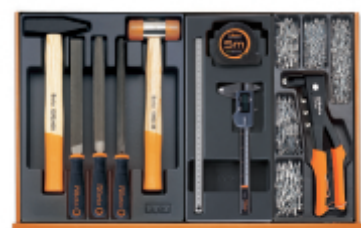
T231 T297 T281