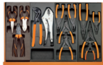
T137 T153 T145 T146