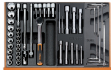
T80 T73 T68